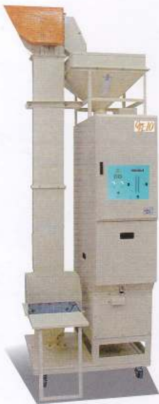
【ユニットイメージ写真】